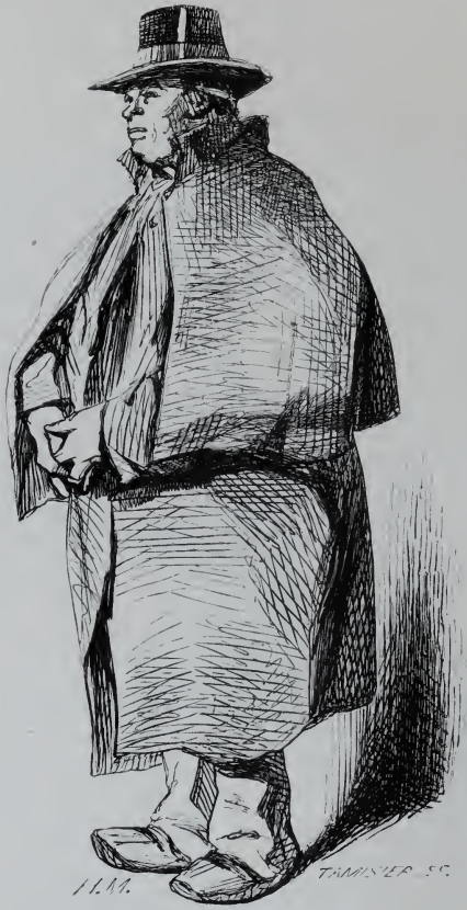
Le Cocher de Fiacre